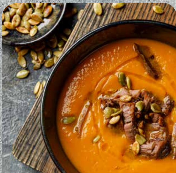
Тыквенный крем-суп с амаретто и брискетом

Грудинка, семечки тыквы, оливковое масло