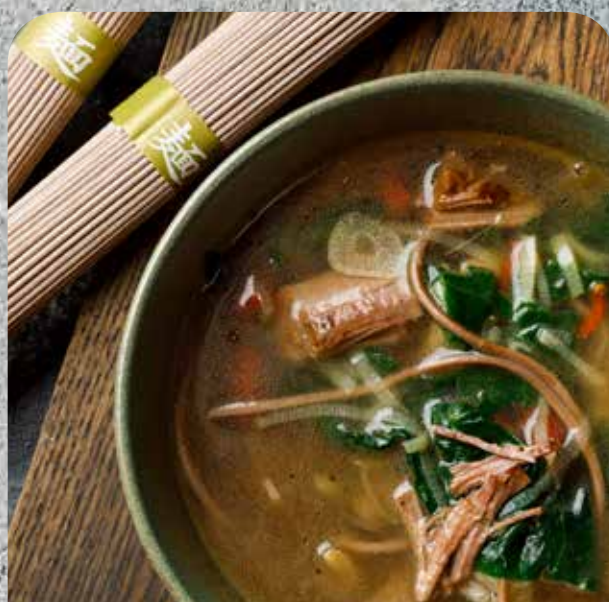
Куриный бульон с брискетом и гречневой лапшой

Грибы вешенки, томаты сушеные, грудинка, шпинат, лапша соба