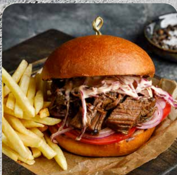
Бургер с копченым брискетом

Булка бриошь, красная капуста, грудинка, помидоры, лук красный, огурцы маринованные, картофель фри